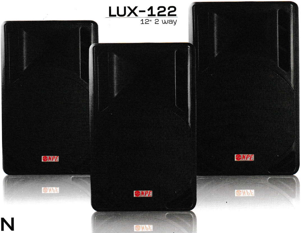
LUX-122 12" 2 way