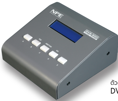
ตัวผู้ร่วมโหวต DVS-50D