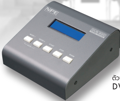
ตัวประธานโหวต DVS-50C