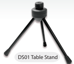
DS01 Table Stand